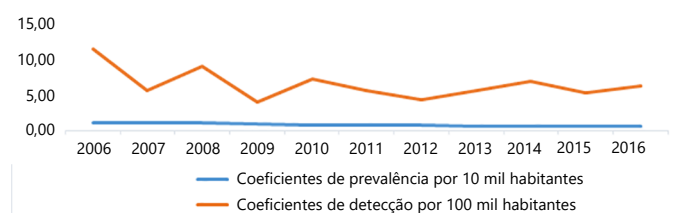
Figura 2. Evolução dos coeficientes de prevalência e detecção de hanseníase em São José do Rio Preto/SP, 2017.

Em relação às incapacidades físicas em SJRP, 91,9% (n=271) dos casos foram avaliados no diagnóstico, dos quais 52,1% (n=141) foram classificados com incapacidades físicas de grau I ou II, ou seja, com alguma deficiência física. Estima-se que, aproximadamente, seis casos